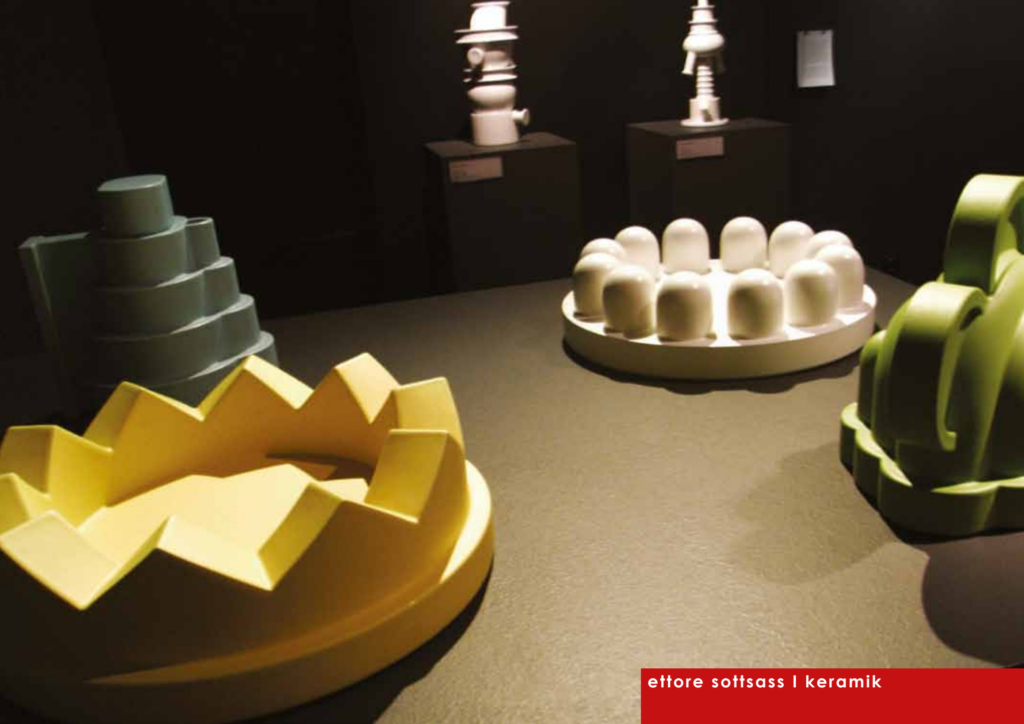
ettore sottsass | keramik